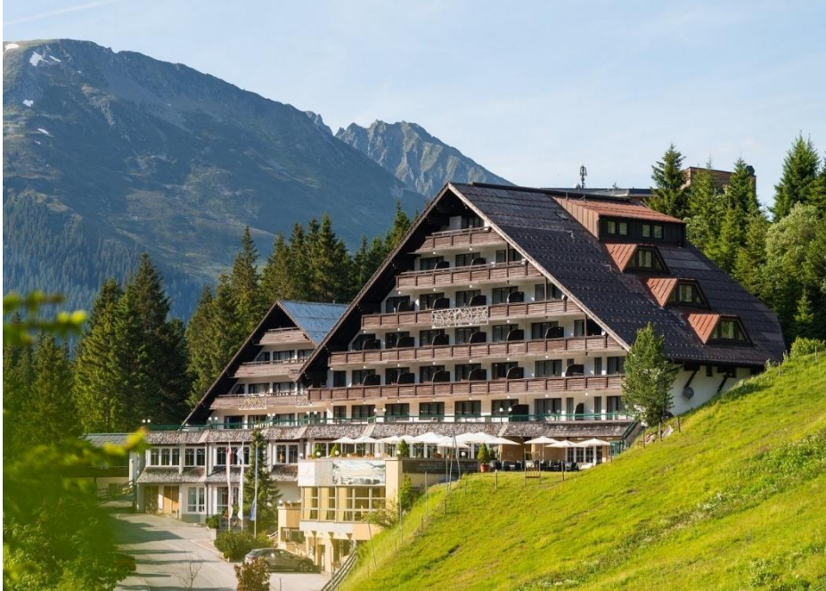
Hotel Lamark, Hochfügen 34, A-6264 Fügenberg

Treffpunkt ist am Anreisetag (Mittwoch) um 18:00 in der Lobby des Hotels Lamark in Hochfügen. Bei einem Begrüßungsgetränk stellen wir uns einander vor und besprechen den Ablauf der kommenden Tage.